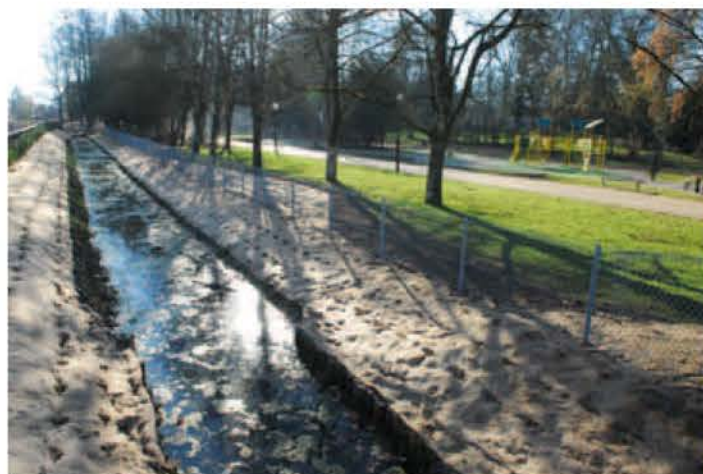
Un petit canal, qui avait été en grande partie rendu souterrain, lors de la création du parc au début du 20 e siècle, a été recréé.