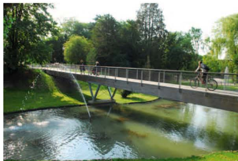
Une passerelle a été créée au-dessus du plan d'eau principal et de certains espaces afin de faciliter la traversée du parc, ce qui augmente la fréquentation des habitants qui se rendent à l'école, au travail, ou vont faire leurs courses.

La communauté de communes de Verdun a lancé un appel d'offre en 2007 pour le réaménagement complet du parc Japiot. La volonté de la collectivité était de favoriser davantage l'appropriation du parc par la population, en le rendant plus ouvert, plus visible, plus accessible et plus accueillant, à tous publics, toutes générations confondues. AD-P, bureau d'études installé à Courtisols, près de Chalons-en-Champagne, été retenu comme maître d'œuvre, notamment pour sa concep-